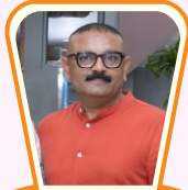
સર્વિસ પ્રોજેક્ટ (ફટાકડા)