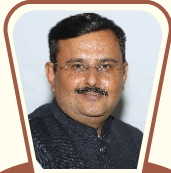
ક્લબ એક્ઝીક્યુટીવ સેક્રેટરી