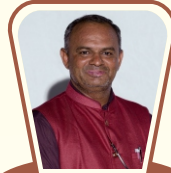
ગ્રામ કલ્યાણ પ્રોજેક્ટ ચેર