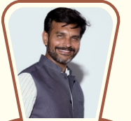
મેન્ટલ હેલ્થ અવેરનેશ ચેર