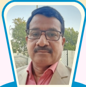
એડવાઈઝર ટુ બોર્ડ