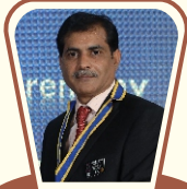
સર્વિસ પ્રોજેક્ટ ચેર