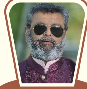
ક્લબ લર્નિંગ ફેલીસીટર