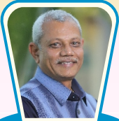
એડવાઈઝર ટુ બોર્ડ