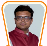
સુદામાની જોળી કો-ચેર