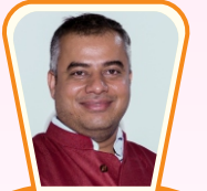
ડીરેક્ટર- ક્લબ સર્વિસ