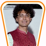
સુદામાની જોળી ચેર