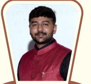
ઈન્ટર. એન્ડ યુથ ચેર