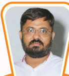
ડેન્ટલ પ્રોજેક્ટ ચેર