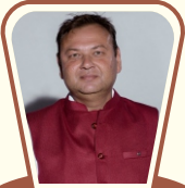
સાર્જન્ટ એટ આર્મ્સ