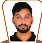
પબ્લિક ઇમેજ ચેર